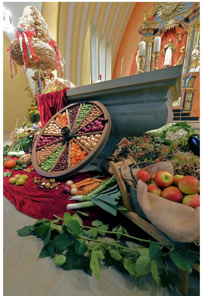
St. Alexius Benhausen, Erntedank 2021