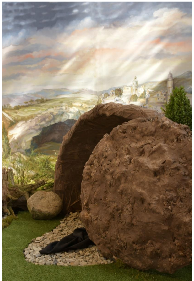
Osterggrab St. Martin Bad Lippspringe

„Gesegnet sei der König, der kommt im Namen des Herrn.“