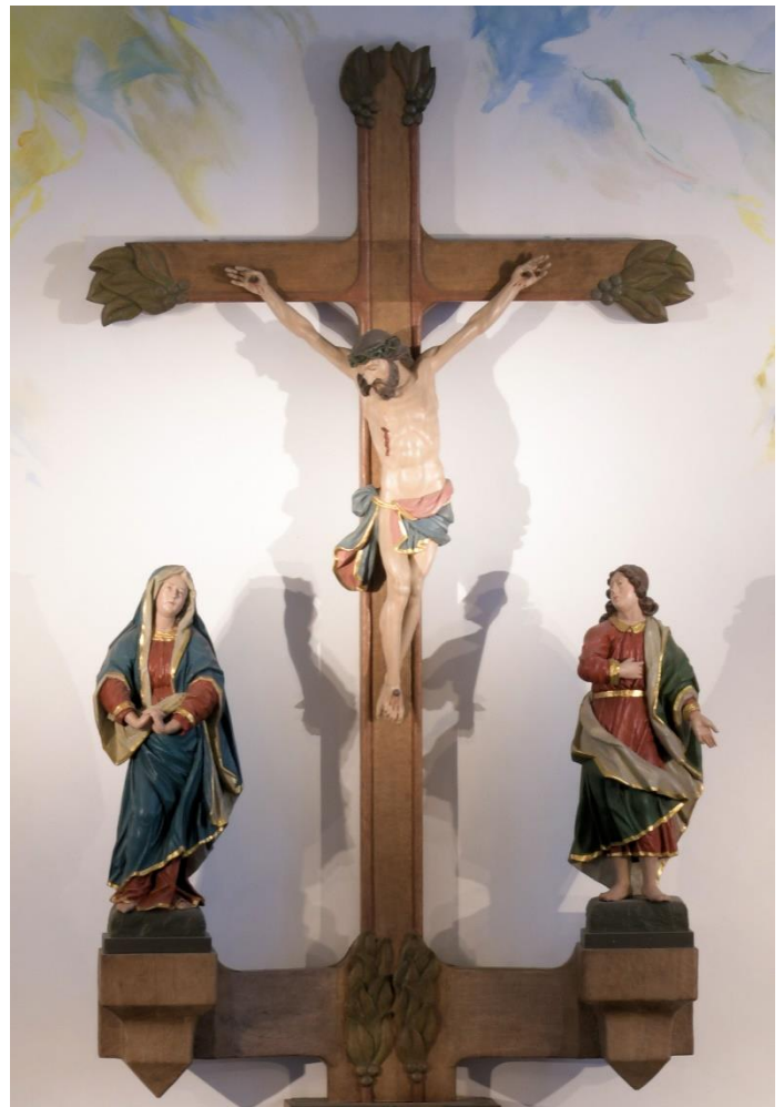
St. Joseph Marienloh

„Wenn dein Bruder auf dich hört, so hast du ihn zurückgewonnen.“