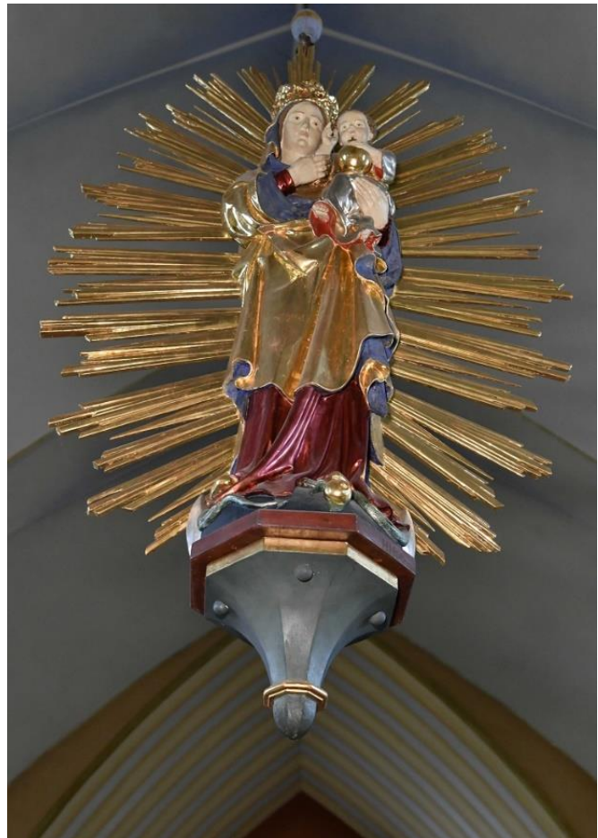
Strahlenmadonna St. Alexius Benhausen

„Ich werde den Vater bitten und er wird euch einen anderen Beistand geben.“