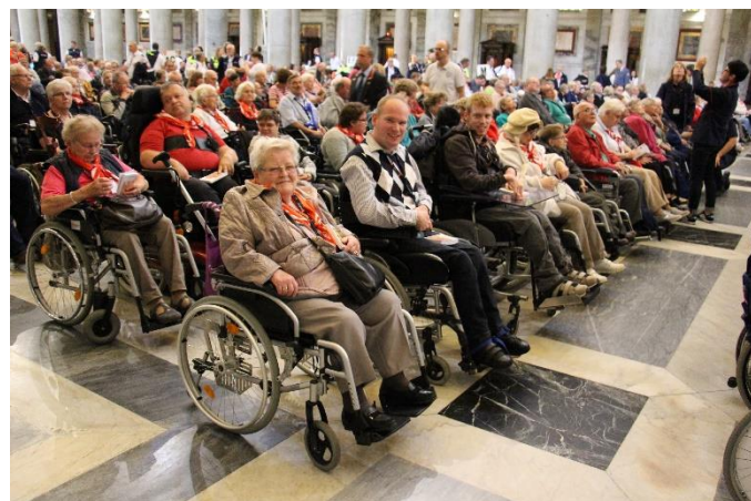
Die Pilgerinnen und Pilger während einer Messe in St. Paul vor den Mauern bei der Romwallfahrt der Malteser.

Die Romwallfahrt vom 1. bis zum 8. Oktober erfolgt in einem modernen, bequemen und behindertengerechten Reisebus ab Paderborn. Erfahrenes Pflegepersonal sowie zahlreiche Helferinnen und Helfer unterstützen die pflegebedürftigen Mitreisenden. Die Unterbringung erfolgt in einem guten Hotel in Doppel- oder Mehrbettzimmern. Mehr Infos sowie die Anmeldung zum Download gibt es auf der Website der Malteser Paderborn: https://www.malteser-wallfahrten.de/rom/anmeldung.html Fragen beantwortet Raimund Neuhaus, Diözesanreferent Ehrenamt der Malteser im Erzbistum Paderborn unter 05251 1355-18.