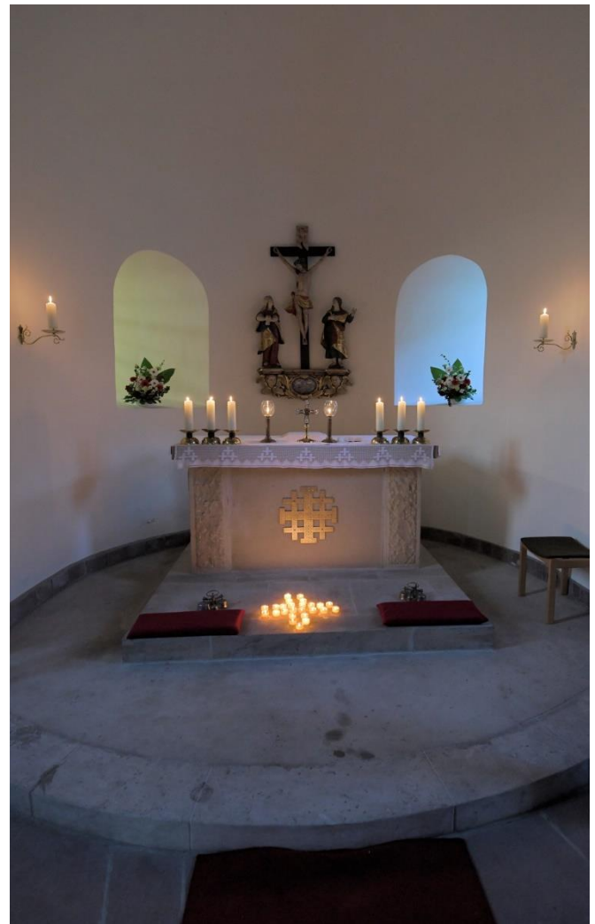
Alte Kirche Altenbeken

„Im Himmel herrscht Freude über einen einzigen Sünder, der umkehrt.“