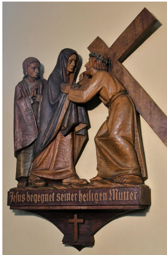
St. Alexius Benhausen