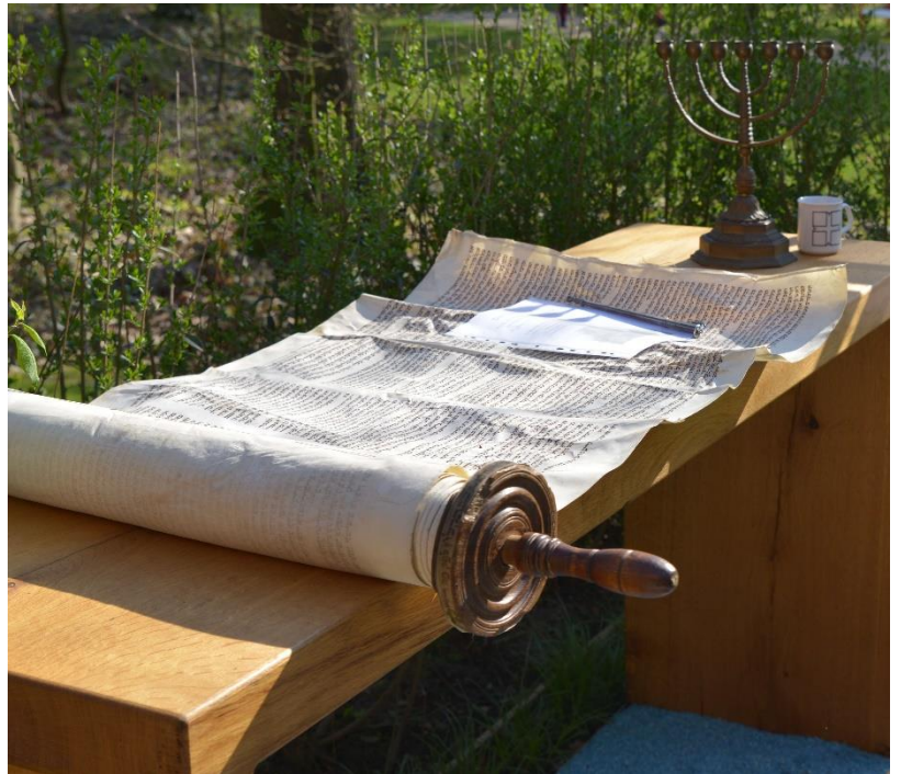
Thora-Rolle, GlaubensGarten Bad Lippspringe

„Heute hat sich dieses Schriftwort erfüllt.“