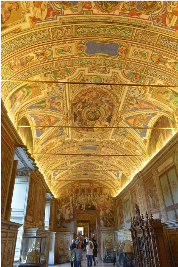
Vatikanische Museen, Foto Bernhard Bauer

Auch wenn die Coronakrise einen Besuch in Rom und den Vatikanischen Museen nicht ermöglichen sollte, kann man sich einige Teile der Sammlungen online in virtuellen Rundgängen erschließen. Dabei sind die Gänge menschenleer und die Werke können aus unterschiedlichen Perspektiven angesehen werden. Die Rundgänge sind unter www.museivaticani.va unter dem Menüpunkt „Sammlungen“ auch auf Deutsch abrufbar. Mit der Zoomfunktion kommt man manchem Kunstwerk näher, als wenn man im Museum präsent wäre.