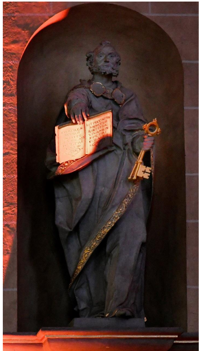
Petrus-Staue aus dem Dom zu Paderborn

„Du bist Petrus; ich werde dir die Schlüssel des Himmelreiches geben.“