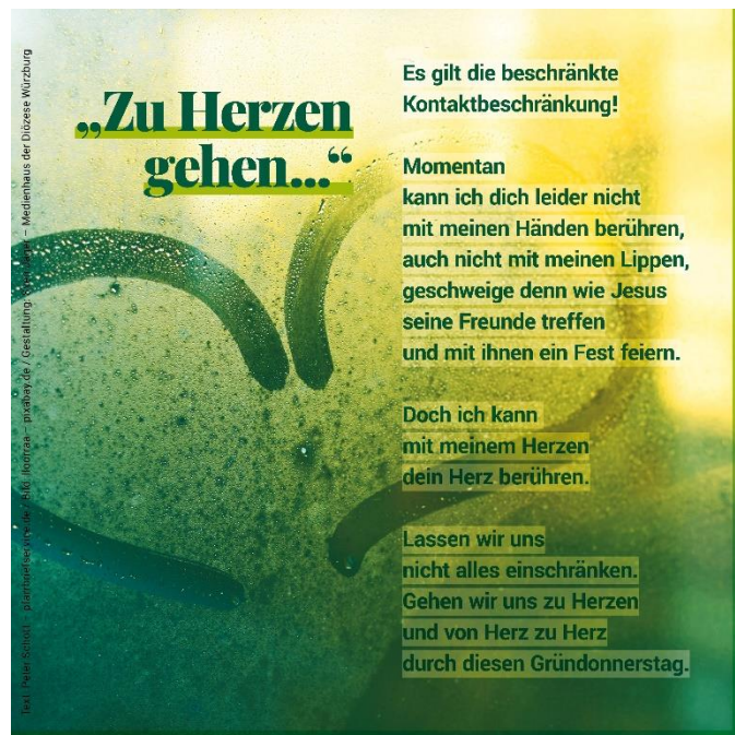
Bild: Text: Peter Schott, Layout: Sven Jäger In: Pfarrbriefservice.de