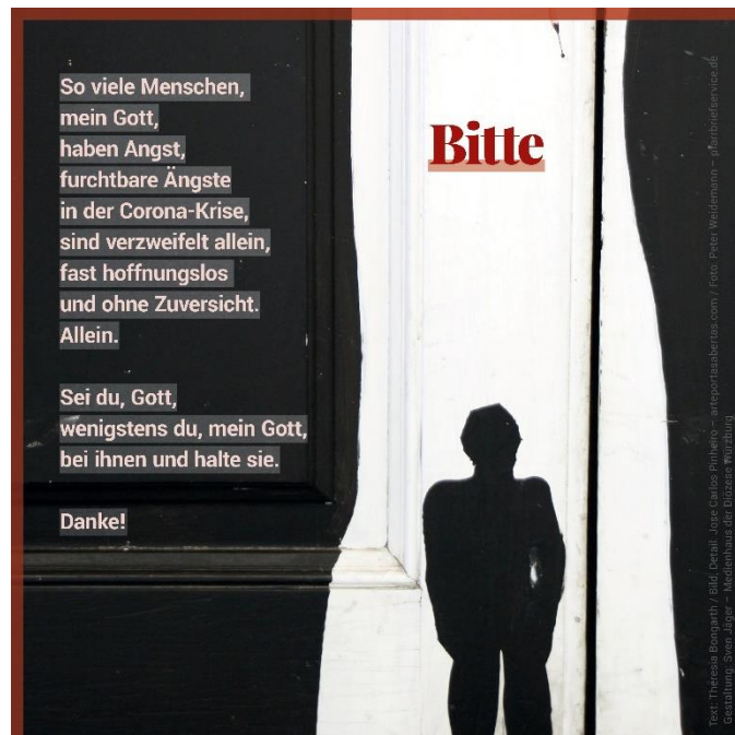
Bild: Text: Theresia Bongarth, Bild/Detail: Jose Carlos Pinheiro, arteportasabertas.com, Foto: Peter Weidemann, Layout: Sven Jäger In: Pfarrbriefservice.de