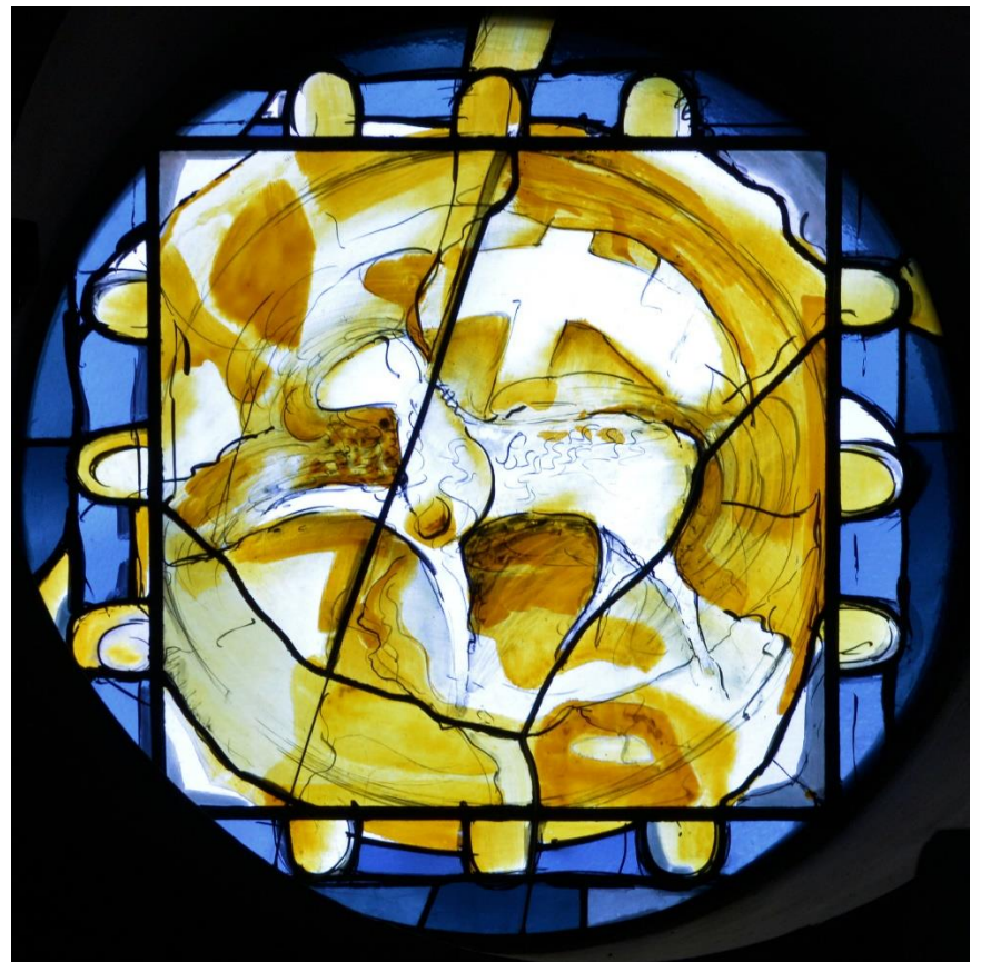
Chorfenster St. Dionysius Buke; Foto Bernhard Bauer

„Gesegnet sei er, der kommt im Namen des Herrn!“